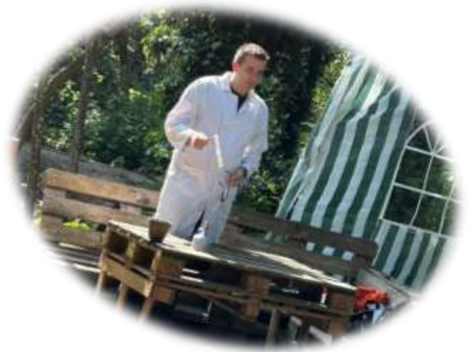
Experimentieren im Freien