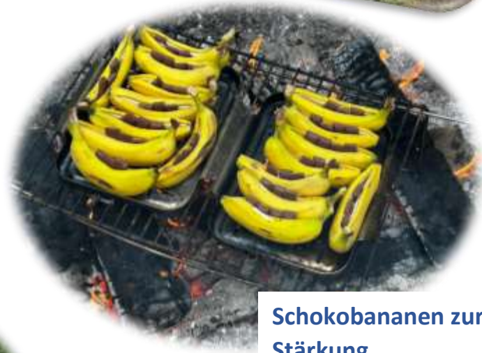
Schokobananen zur Stärkung