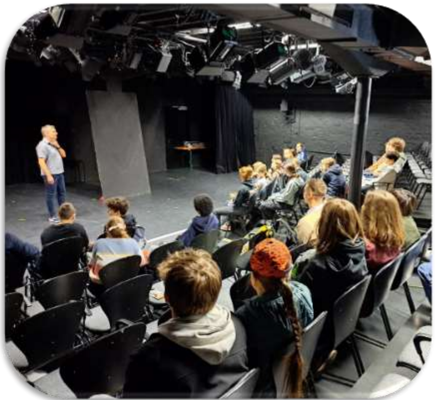
Generalprobe im SANDKORN