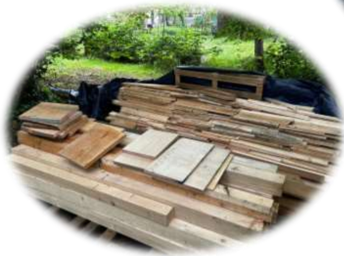
Holzlieferung – nun kann weiter gebaut werden...