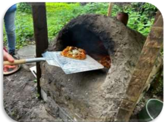
Pizza aus dem selbstgebauten Lehmofen